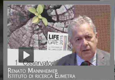
1 Osservatorio RENATO MANNHEIMER ISTITUTO DI RICERCA EUMETRA