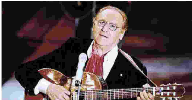
Renzo Arbore, suo padre voleva che diventasse anche lui un dentista

Il programma, registrato live, verrà riproposto agli ascoltatori su LifeGate and Sound, il canale musicale di LifeGate fruibile online, in fm e su app, lunedì 26