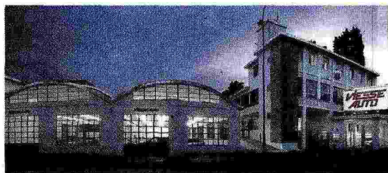
Lo showroom di Viesse Auto a Milano